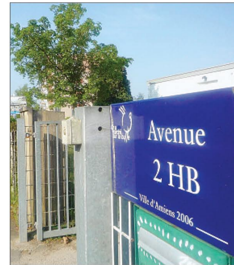
Avec sa plaque de rue à l'entrée, l'association 2HB est incontournable.

Au pied des immeubles et des habitations, à l'arrière d'une école maternelle d'Amiens nord, l'association 2 HB a trouvé son nid douillet et Norédine Allam aussi.