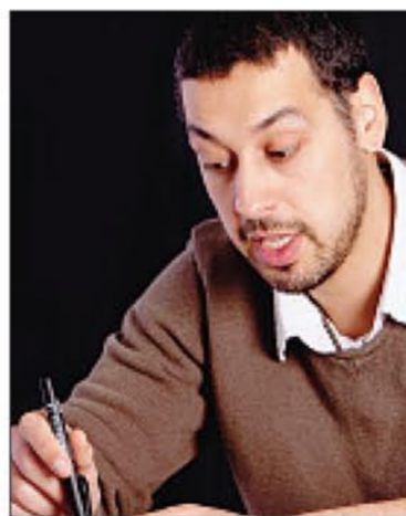
fait des fresques pour la SNCF, la DRAC, le musée. C'est bien plus tard que j'ai compris que c'était une chance. Mais ça a marché tellement vite et tellement fort que j'ai été usé et je me suis lassé.

J'ai toujours pris mon travail comme un jeu